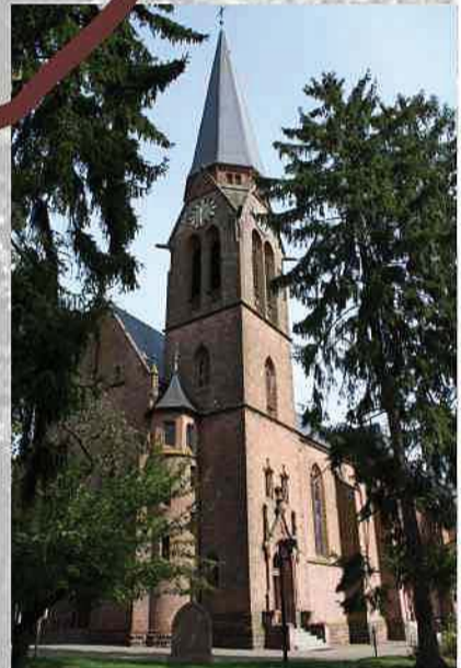
St. Laurentius Kirche