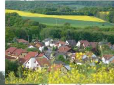
Blick auf Althornbach