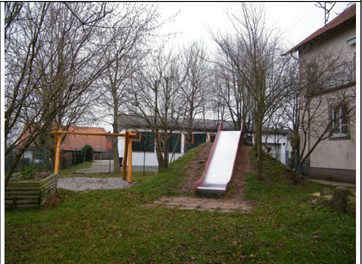
Spielen im Außenbereich