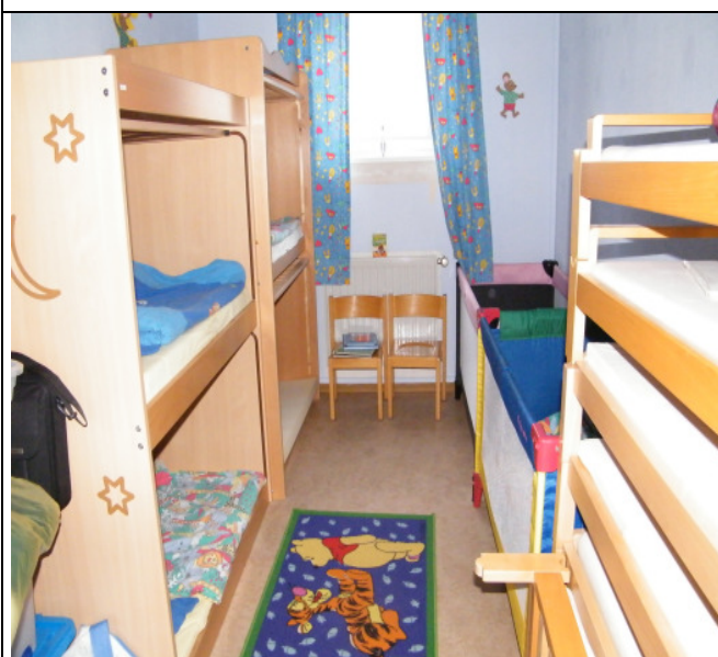
Schlaf – und Ruheraum

Evtl. Kosten für Verpflegung sind gesondert zu entrichten. Bitte informieren Sie sich bei der Leitung der Kindertagesstätte.